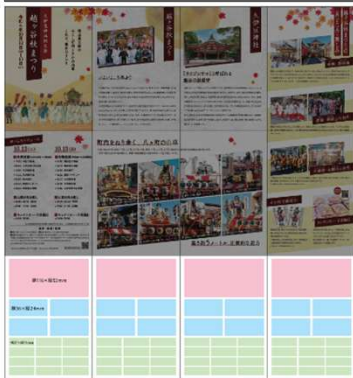
【パンフレットイメージ】幅515mm 高さ546mm 24面の内8面広告